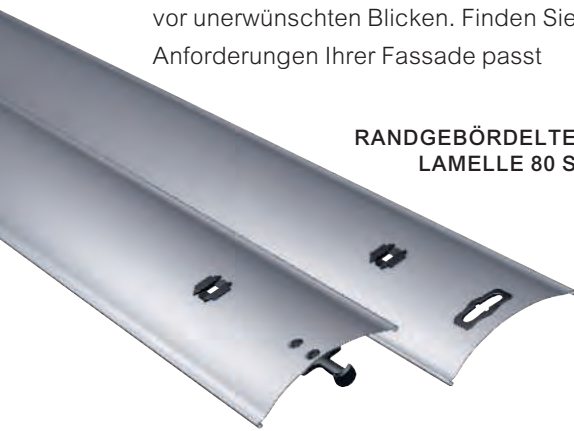
RANDGEBÖRDELTE LAMELLE 80 S

ENERGIEEFFIZIENT. Geringere Pakethöhen ermöglichen kleinere Schächte und sparen so Energiekosten, sichtbare Blenden werden so filigraner