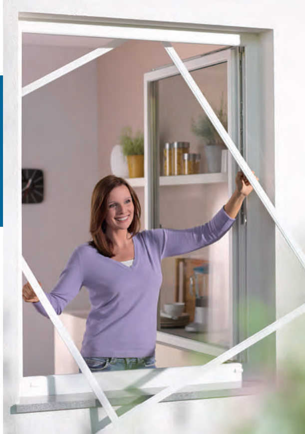
Fest- und Steckrahmen